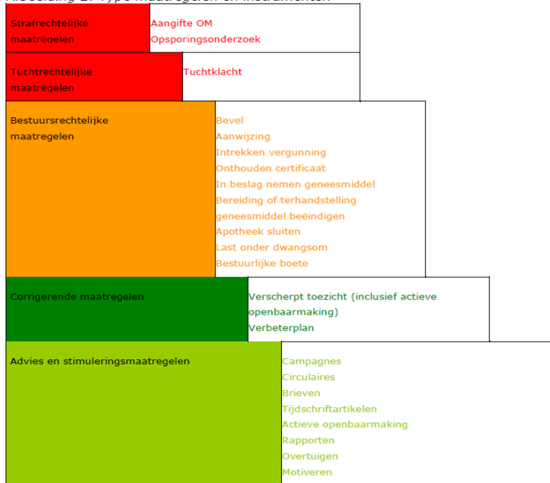
Afbeelding 2: Type maatregelen en instrumenten

Maatregelenpiramide in theorie en IGZ handhavingskader